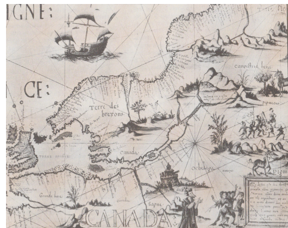
*Carte de Descelliers 1550

Tout en présentant les événements, il en expliquera les conséquences politiques et sociales.